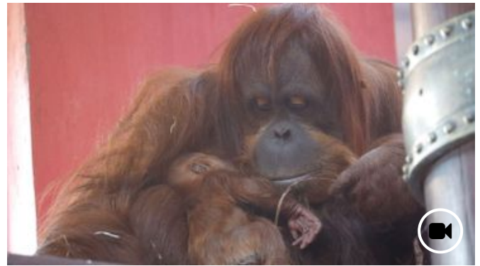
🕒 31 octobre 2018 Un bébé orang-outan est né à Pairi Daiza, un bel espoir pour une espèce en danger d'extinction