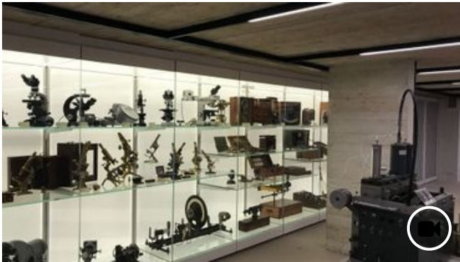
🕒 31 octobre 2018 Bilan positif pour le premier anniversaire du Musée L à Louvain-la-Neuve