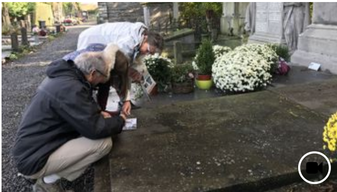
🕒 31 octobre 2018 Insolite à Tournai : un jeu de piste en famille... entre les tombes du cimetière du sud